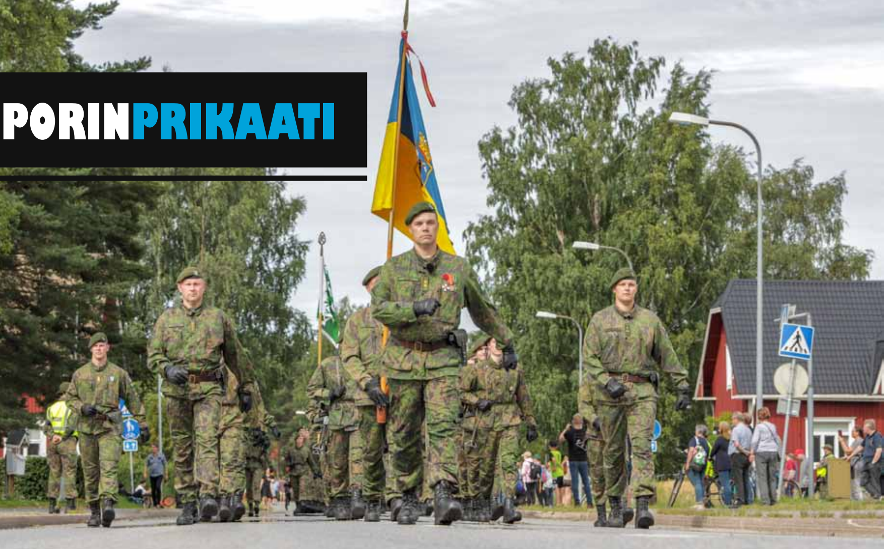
Pohjanmaan jääkäripataljoonan ohimarssi Kuortaneella.