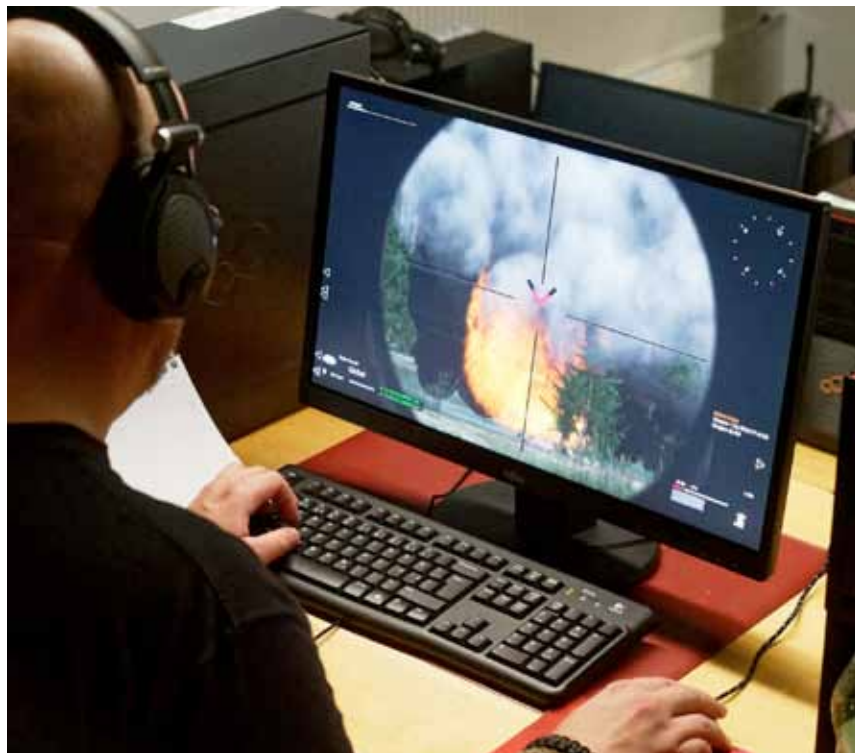
... ja nyt se on tuhottu.