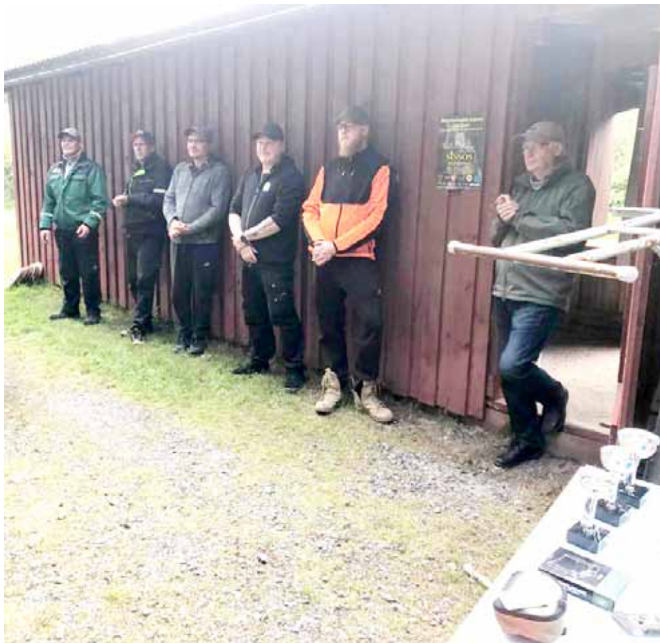
Kauden voittajakolmikko odottaa yhdessä muiden kanssa palkintoja.