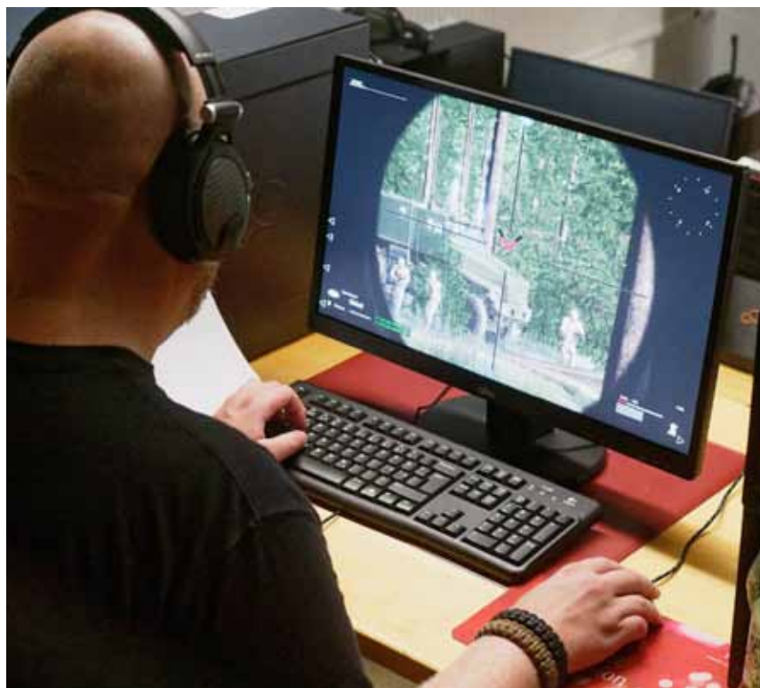
Vihollisen panssaroitu ajoneuvo tähtäimessä ...