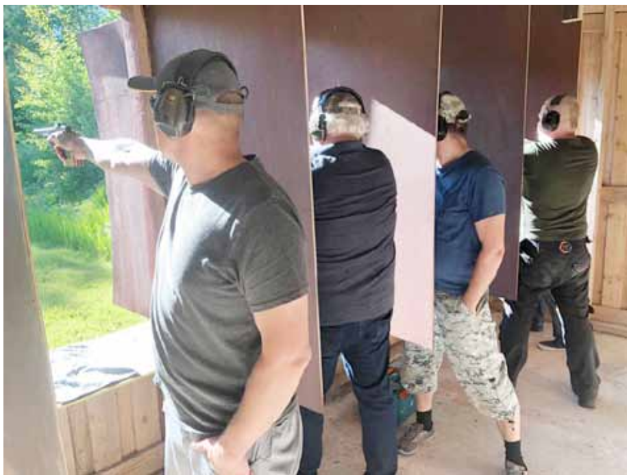
Nakkilan pistooliradalla ampujien harmiksi laskeva ilta-aurinko häikäisee.

kuuluu siitä, että hyvillä mielin osallistuja lähtee kotiin. Kotiinviemisenä voi olla pytty tai ase-aiheinen lippis.