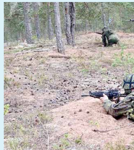
Paikallispuolustusharjoitukseen sisältyi Varsinais-Suomen maakuntakomppanian valmisjoukkueen osallistuminen Porin prikaatin taisteluampumarjoitukseen varsinaista harjoitusta edeltävänä viikonvaihteena.